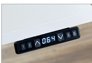
Höhenanzeige (Memory optional)