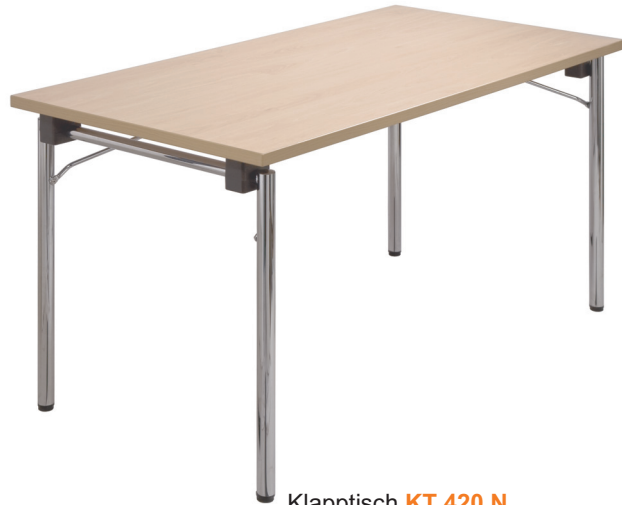
Klapptisch KT 420 N