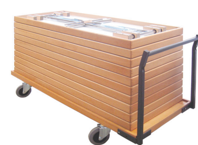
Tischtransportwagen TTW Horizontal