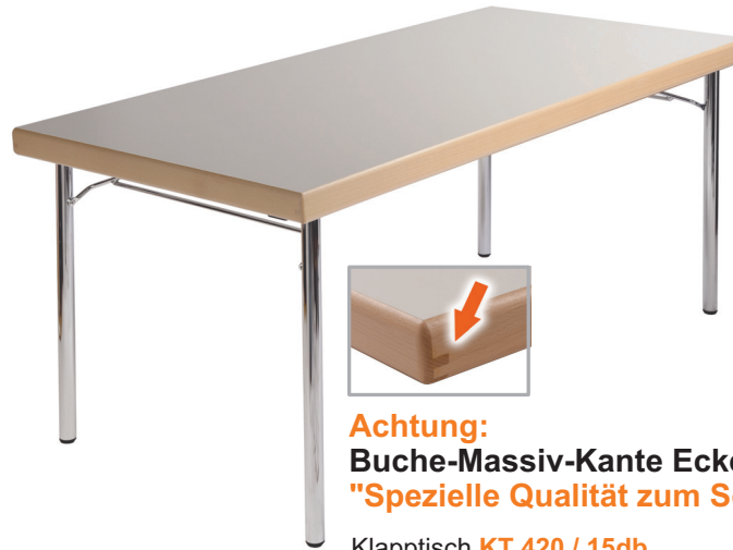
Klapptisch KT 420 / 15db