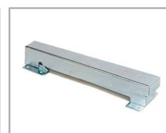
Klappbeschlag SV 3K in Metall