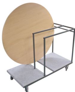
Tischtransportwagen TTW vertikal "rund"