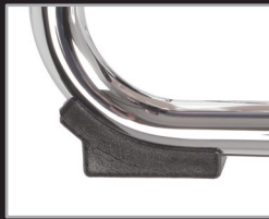
PVC-Gleiter als Kippschutz